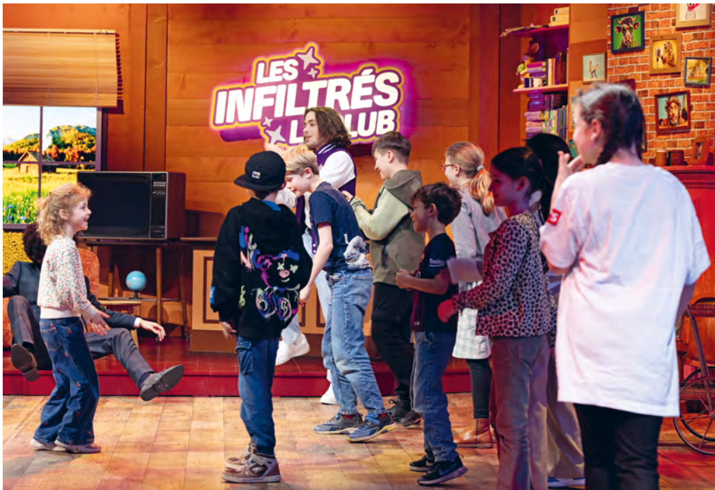
... et aux blagues loufoques de ses animateurs!