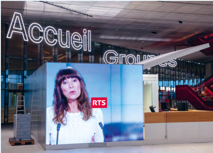
Le bâtiment RTS Lausanne-Ecublens

Les 30 et 31 mai, un week-end important se profile pour la RTS : elle dévoilera au public son nouveau site de Lausanne-Ecublens. Au programme de ces deux journées de portes ouvertes : des écoutes commentées et enregistrements de podcasts en public, de la musique, des visites en continu des studios et des cars de production, des émissions en direct pour l'occasion, des expositions, des expériences immersives, et de nombreuses animations et activités pour toute la famille.