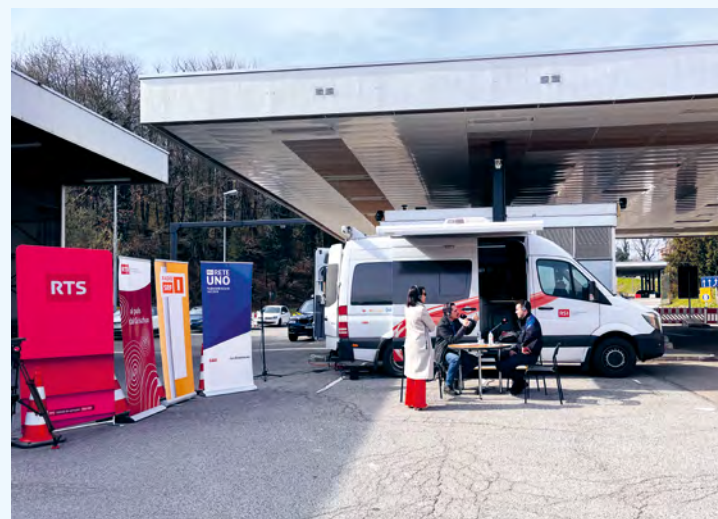
La première émission, au Tessin, évoquait la thématique des frontières.

langues nationales pour s'exprimer dans leurs reportages. Et la tâche n'est pas des plus aisées, d'après Stéphane Gabioud, qui relève que les Tessinois.e.s et Romanches, les plus minoritaires, sont souvent les plus plurilingues de Suisse.