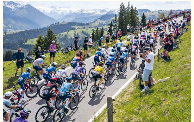
Le Tour de Romandie 2026

Le Tour de Romandie 2026 a rencontré un nouveau succès d'audience sur la RTS : plus de 200 000 personnes l'ont suivi, avec une audience moyenne de 38 000 personnes et une part de marché de 30,7%, en hausse par rapport aux années précédentes. Un pic à 104 000 téléspectateurs et téléspectatrices a été enregistré lors de l'arrivée finale le 3 mai. Ces résultats confirment l'attachement du public romand à l'événement.