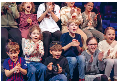
Dans le public aussi, les jeunes se déchaînent

Au fil des enregistrements, le tandem se sent gagner en spontanéité. Après des premiers «late-night shows» au canevas corseté, précis, ils osent sortir du cadre. «Quand on est trop dans la fiction pure, avec des vanes très écrites, les enfants le perçoivent. On cherche à retrouver un côté plus authentique, décontracté. Parfois, Laurent me surprend avec ses improvisations sur le plateau qui me font rire», lâche son acolyte. Le duo