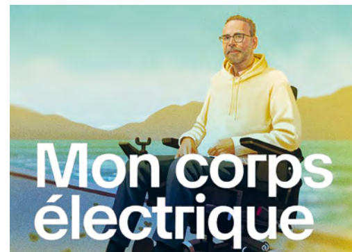
Mon corps électrique © RTS

Le podcast Mon corps électrique se distingue par la force de son récit, mêlant témoignage personnel et enquête journalistique. Le Conseil du public souligne la richesse de cette approche immersive, qui éclaire les enjeux scientifiques, éthiques et sociétaux liés à la recherche médicale. Cette production est considérée comme particulièrement per-