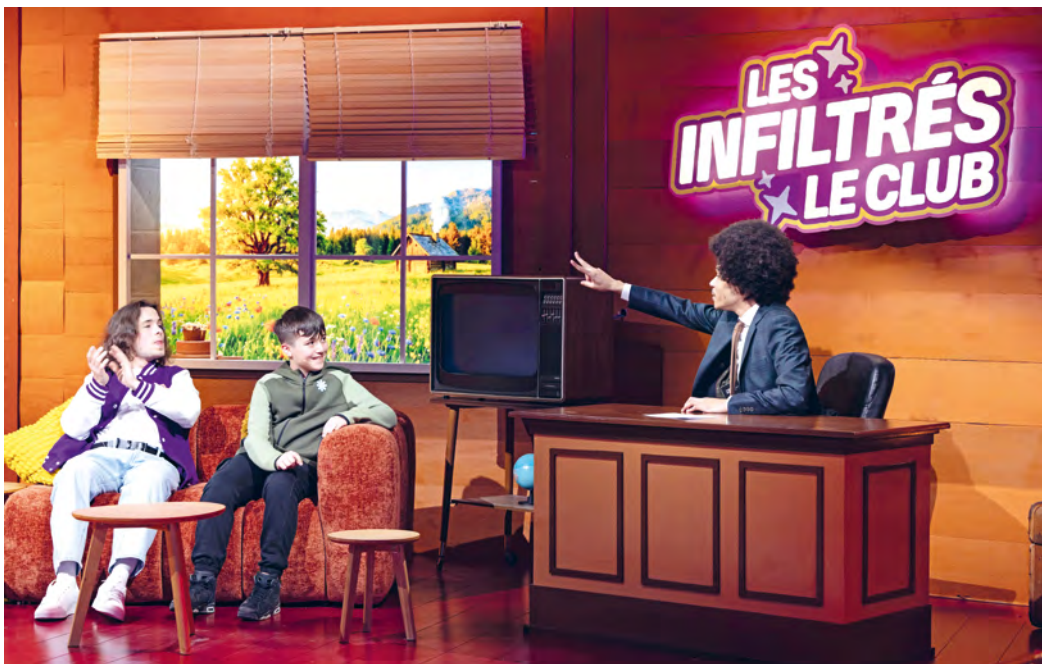
Les enfants participent à l'émission...